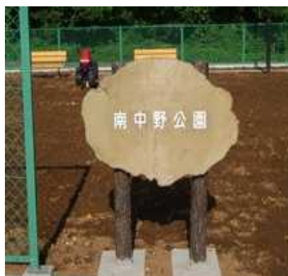
宅地造成工事現場内に建設中の南中野公園

施工側から提供された周辺地図や設計図、工程表を参照しながら、質疑応答がなされました。特に周辺道路は、子供たちの通学路でもあり朝晩の通勤の抜け道にもなっていることから安全面や振動など、住民側から細かい意見や要望が出されました。今後とも、町会においても造成に目を光らせて、様々な問題提起をしておく事となりました。