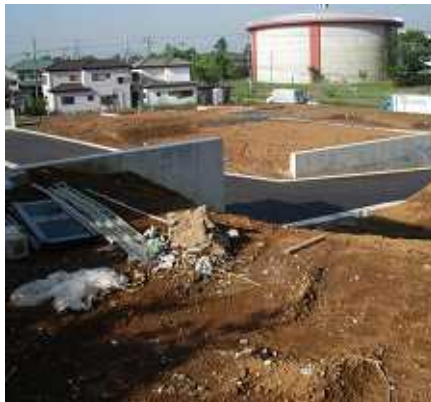
南中野の宅地造成工事現場

六月の栗林に続き、七月十日(日)十時よりはらトピアにおいて、上志津原南中野三四番一にお