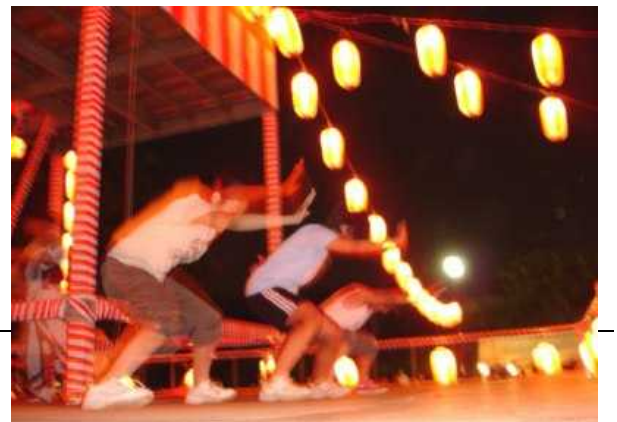
今年も、町会有志の方々の櫓太鼓と……「紅雀」さんの和太鼓……そして「パープルダンサーズ」のロックソーラン