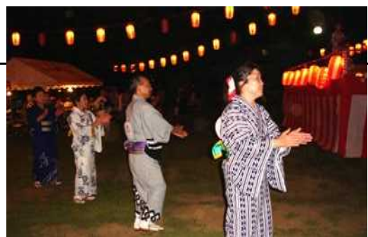
踊る！踊る！大人も子供も、踊れなくても真似して踊る