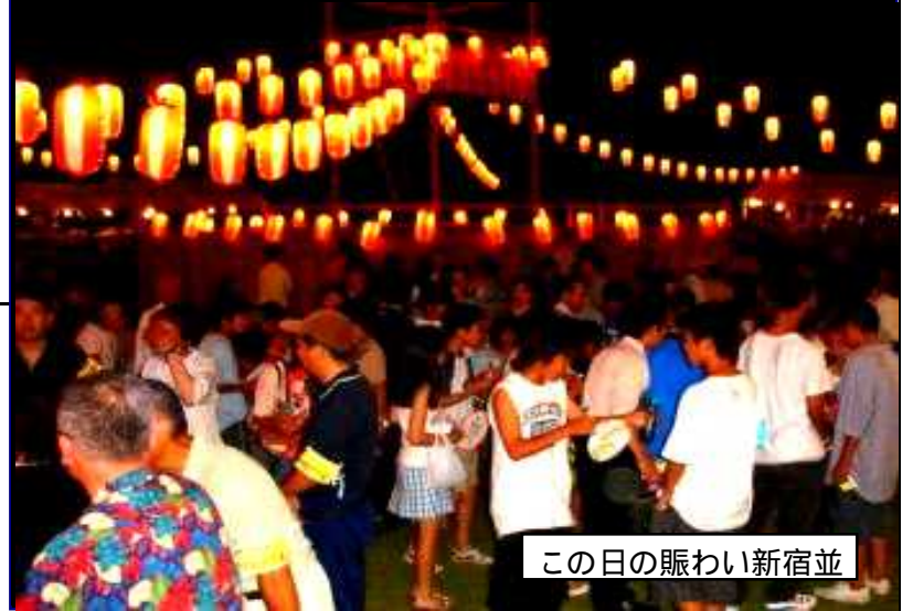
この日の賑わい新宿並

町会行事の最大のイベントである平成17年度の「盆踊り大会」が、さる7月29日(金)30日(土)の2日間に渡り、上志津原児童公園で盛大に行われました。 大会は西日共大盛況のうちに終わり、今年も紅雀さんによる和太鼓の曲打ちや、紅雀さんや上志津中学校の生徒さんと紅雀さんによる、「ロックソーラン節」の熱演もみられました。また、当町の自治会館内では地元サークルの皆様方による、「絵手紙」と「木目込人形」の作品展示があり、盆踊り大会に花を添えました。 今年の盆踊り大会の様態を写真で紹介いたします。 …広報係