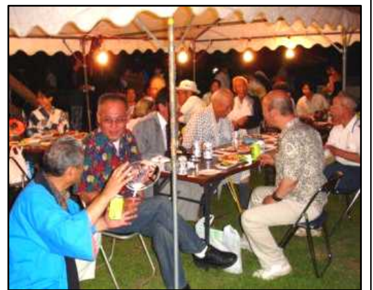
来賓席も盛り上がり上がっていました。