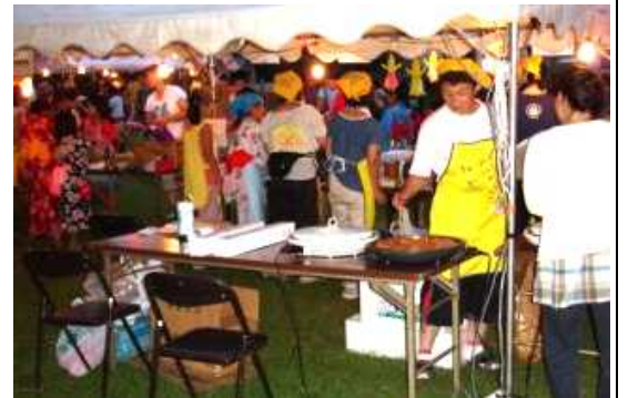
いらっしゃいませ！まいどありー！模擬店はどこも大繁盛でした。(上は子供会店 下はツインズ店)・・・売れて売れて裏方さんも大忙しでした。