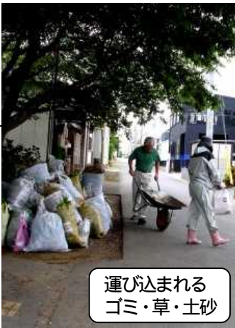
運び込まれる ゴミ・草・土砂

私にとって初めての仕事でしたが、楽しくやらせていただきました。それから参加して下さった小中学生の皆様、ご協力ありがとうございました。