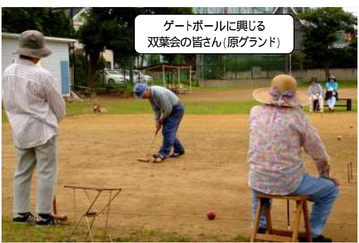
ゲートボールに興じる 双葉会の皆さん(原グランド)

ゲートボール週2回(火・木)広いグラウンドで大声で笑いながらゲームを楽しみます。