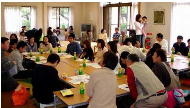
団地ごとに島になって「グループ討議」をし、上志津原町会において自分たちの班の名前や、初代の班長を決める話し合いが行われました。