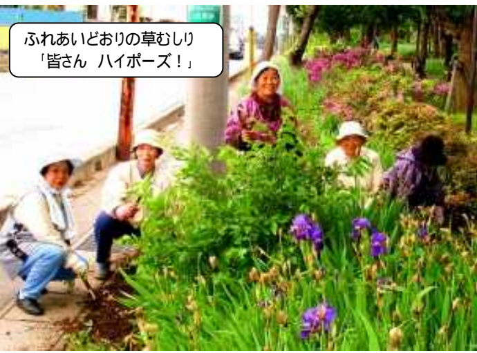
ふれあいどりの草むしり 「皆さん ハイポーズ！」

月初め、公園清掃、月末には月例会、月例会の内容は、誕生会、1ヶ月の連絡事項の知らせ、一班々六班の各班長が会員の現況報告最後は喉をうるおし、軽食を食べながら楽しい歓談のひとときです。又春秋には泊旅行があり、日帰り旅行は年2回第二支会で参加できます。