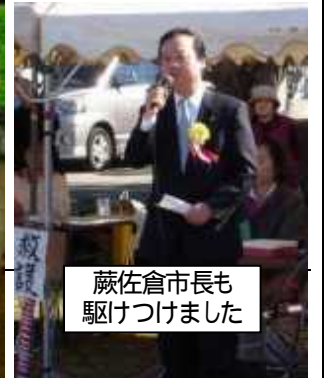
蔵佐倉市長も駆けつけました

追伸：でも次回班長のおりには、運動会の係りは遠慮させて頂くかも知れません。忙しい毎日でした。