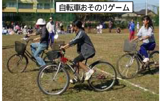
自転車おそりゲーム