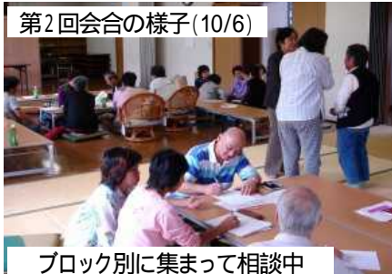
ブロック別に集まって相談中