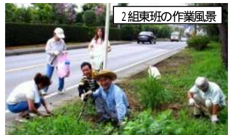
2組東班の作業風景