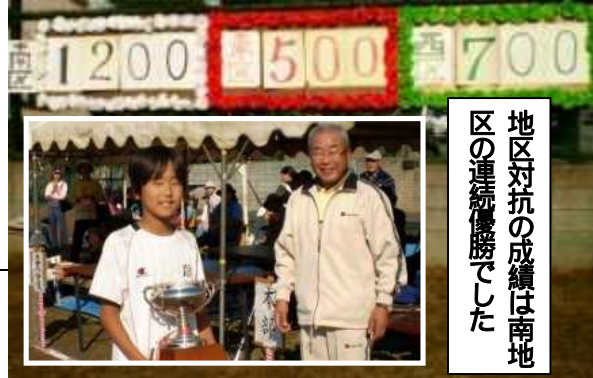
地区対抗の成績は南地区の連続優勝でした