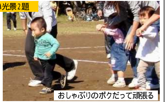
おしゃぶりのボクだって頑張る