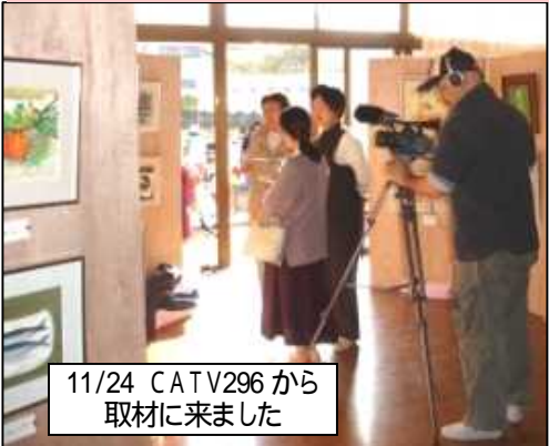
11/24 CATV296から取材にきました

「絵てがみ」「木目込人形」「水彩画」「押し花」「パステル画」「生け花」のサークルから力作が展示され、皆さん感心しきりでした。