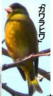
「ふれあいどおり」で撮った珍しい小鳥を紹介します。