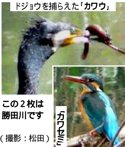
ドジョウを捕らえた「カワウ」