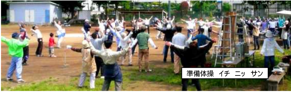
準備体操 イチ ニッ サン