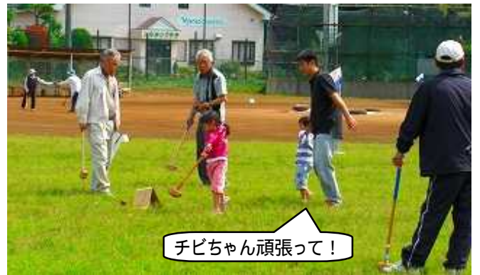
チビちゃん頑張ってる!