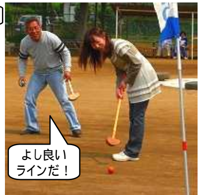
よし良いラインだ!