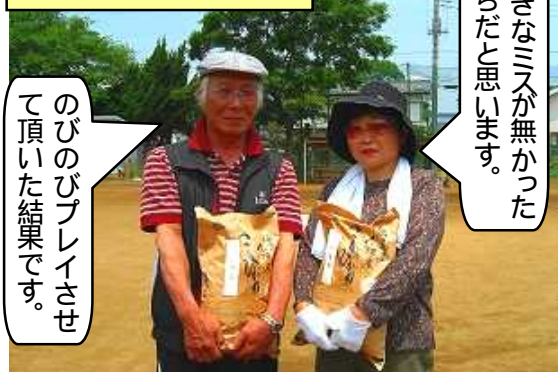
のびのびプレイさせて頂いた結果です。