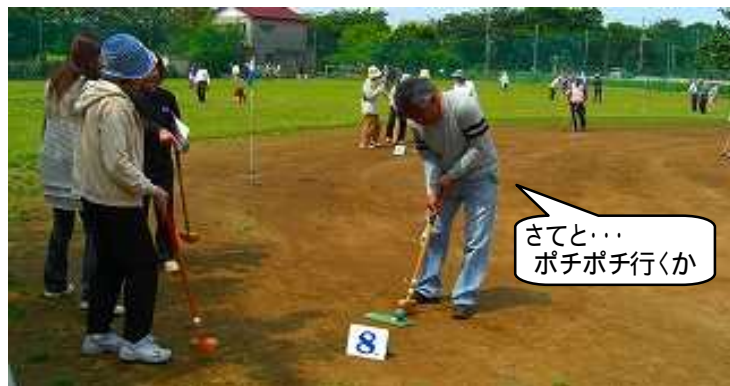
さてと...ポチポチ行くか