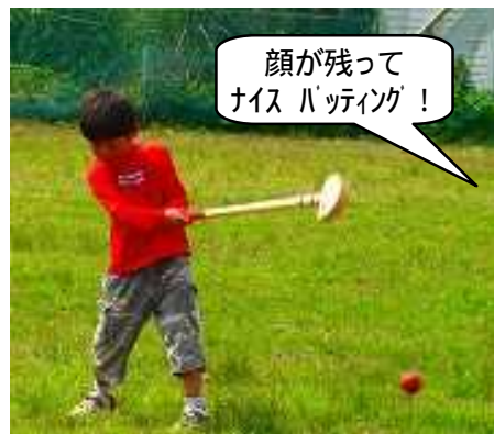
顔が残ってナイスバツイング!