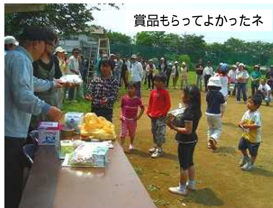
賞品もらってよかったネ