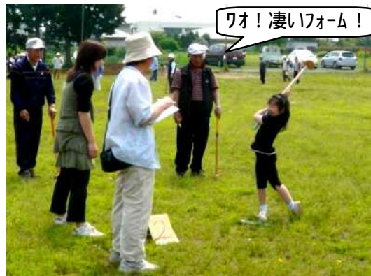
ワオ! 凄いフォーム!