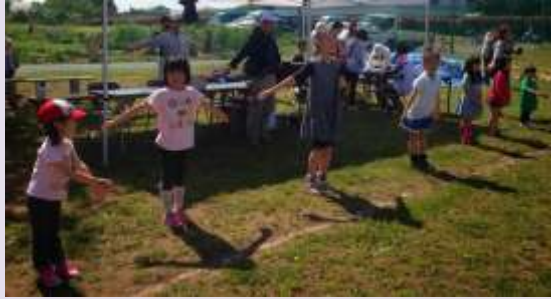
まずは皆でラジオ体操。子供達のリードで、1♪・2♪・3♪・4♪ っとね!