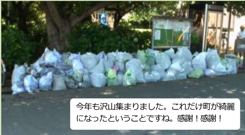
今年も沢山集まりました。これだけ町が綺麗になったということですね。感謝!感謝!

6月8日(日)に予定した幹線道路清掃でしたが、あいにくの雨天で1週間の順延となりました。ちなみに、8日の明け方にかけて佐倉市では降水量37.5ミリを観測していたそうです。15日(日)は快晴、順延にも関わらず沢山の方に参加頂き、綺麗な町が更に綺麗になりました。皆さん、ご協力ありがとうございました。 幹線道路沿いの遊歩道ふれあい通り公園は、佐倉市が委託する業者によつて年2回の草刈りを行っています。以前は、町会総出で草刈りをしてきたそうです。時を遡れば便利な機械がない頃のご苦労は想像が及びません。世代が替わり形を変えながらも町を綺麗にしようと思う気持ちが生かされ受け継がれていることを感じる一日でした。9月の幹線道路清掃も力を合わせて綺麗なまちづくりにご協力をお願い致します。