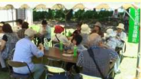
ゴール後はしばし歓談。焼きそばを食べながら今日気付いた事を振り返り。

ゴールの後は、はら公園で社協名物の焼きそばが振る舞われました。他にもフランクフルトやキャベツ焼き等(有料)があり、運動の後だったのでつい食べ過ぎました。カロリー的にはプラスだったかな。また、来年!