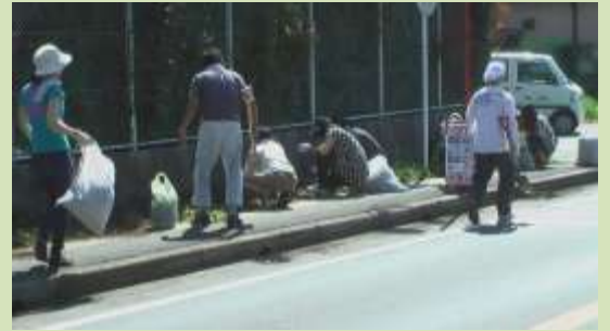
腰を屈めての草むしり。疲労が足腰に溜まるんですよね。皆さん、ありがとうございます。