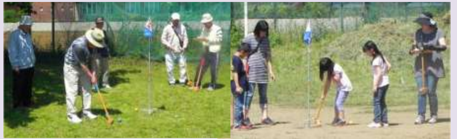
初めての方もベテランの方も皆さん真剣です。ボールは真つすぐ転がってくれないので難しいはずなのですが、幾つもホールインワンが出ていました。皆さん本当に上手い! 子供達も負けずに頑張れ!