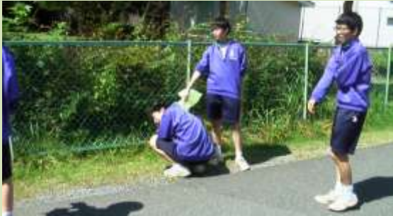
上志津中の生徒13名が地域清掃活動に参加。今はちょっと休憩中です。