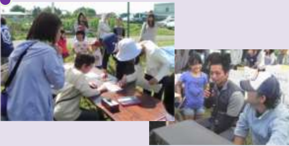
大会運営の裏方さん(当年班長・総務)、準備お疲れ様でした。無事に競技がスタートしました。