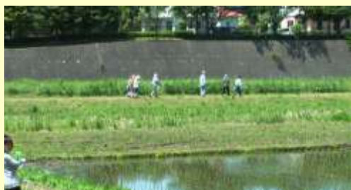
はらの田園風景に行く。勝田川は護岸工事が行われ歩きやすくなっていました。