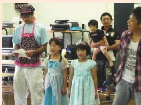
子供たち、とっても頑張ってくれました。お父さんも熱演。火の元にはご注意ください!

「火の元の始末」「燃えやすいもの」「魔の指す瞬間」に気を配る。気持ちの緩みがないか家族全員でチェックすると効果が持続できます。 いつもお世話になっている佐倉市八街市酒々井町消防組合志津消防署志津南出張所から今年も職員派遣を頂き、心肺蘇生など救命活動や消火器の種類・使い方など実践的な指導を行って頂きました。日赤奉仕団の皆さんには非常食「アルファ米」の作り方を実演頂きました。フリーズドライ加工された食材はそのままでもとても美味しかった。社会福祉協議会の皆さんには名物とも云える「とん汁」を振る舞って頂きました。3杯4杯とおかわりも…。 皆さんに楽しく興味を持ってもらえるようにと始めた寸劇は今回で2回目。一緒にチャレンジしてくれた子供達は前日練習からすごい熱が入りようで「もう一回やりたい!」、終わってみれば21時を過ぎていました。防災訓練のテーマ「住宅火災」に沿って「アナと雪の女王」をモチーフにしたシナリオ、子供達は可愛いドレス、お母さんは可愛いエプロン、白熱した演技を見せるお父さん、音響・ナレーション・黒子役、いったい何人が関わっていたのでしょうか。 今日一日を振り返り一つのイメージを持ちました。もしもの時、今日のように皆が集まって協力して苦境に立ち向かっているのだらうと。本当に良い町です。今回ご参加頂けなかった皆さんも次回のご参加をお願いいたします。 (防災防犯委員会 事務局)