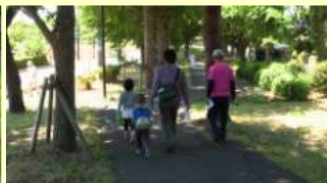
ちびっ子も参加していました。最後まで自分の足で歩いたそうです。