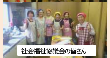
社会福祉協議会の皆さん