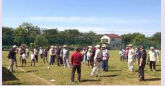
今年も70名を超える方々に参加頂きました。晴天の下、自慢の腕を競い合いました。

5月11日(日)、今年度最初のイベントです。天候に恵まれ楽しく一日を過ごしました。大会準備のグランド草刈りにご協力頂きました野球関係の皆さん、町会有志の皆さん、ありがとうございました。競技はスポーツ大会にすっかり定着したグランドゴルフです。子供から大人まで同じルールで競技が出来るって楽しいですよ。余談ですが、グランドゴルフは鳥取県泊村(現在は湯梨浜町)で誕生し、昭和57年に文部科学省の補助事業の指定を受け、全国に広がって行きました。ゴール的(ま)は泊村に敬意を払い正式名称を「トマリ」と呼びます。