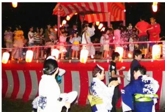
写真は昨年の様子です。いったい何人いたのでしょうか。

恒例の盆踊り大会。昨年は「でたらめ踊り」が初披露されました。子供達も自分で作った狐の面を付けていましたね。お祭り気分がUP。盆踊り部会の皆さんのリードで子供達も踊りの輪に。子供達が舞台上上がる時間帯が用意されていますが、舞台は載り切れない程の大盛況、子供達のパワーは本当に凄いですね。是非この機会にご家族揃って夏のビックイベントに足を運んで下さい。今年も一緒に盛り上がりましょう！