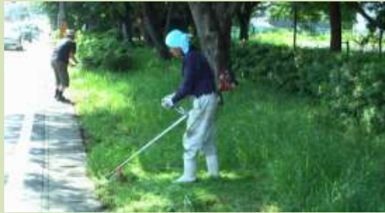
この時期の草木は伸びるのが早い。草刈り機が登場して伸びた草をばっさり!