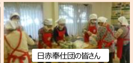
日赤奉仕団の皆さん