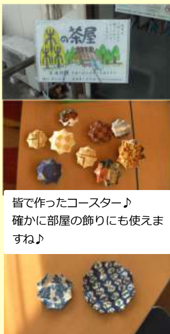
皆で作ったコースター♪ 確かに部屋の飾りにも使えますね♪

10月25日(土)、森の茶屋が開催されました。今回はコースターの制作が行われました。たった一枚の紙で八角形のお皿になってしまいました。紙は新聞のチラシでも良いです。少し硬めですがデパートの紙袋は「色」や「模様」が綺麗ですから良い品ができるようです。綺麗にできたコースターはお洒落でインテリアにも使えます。皆さんかなり真剣に取り組んでおられました。