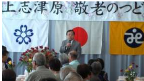
蕨市長の挨拶。市長は開式時間前に到着し敬老者から大歓迎で迎えられ、開式まではまるで握手会の様な和気あいあいとした和やかな雰囲気。