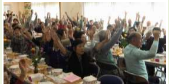
佐倉ふるさと体操の様子です。座りながらもできリラックス効果抜群です。式典も長いですがからね。こういった工夫が大切ですね。