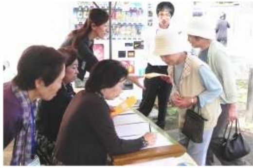
はらトピアは11時の会場を前に受付で大賑わい。中には9時30分に見えられた方も居られたとか。

9月28日、はらトピアで敬老会が行われました。上志津原在住の75歳以上の方219名のうち80名が出席されました。佐倉市主催、社会福祉協議会運営のものはらトピアに会場が設営されました。式典は国歌斉唱で始まり、佐倉市長の挨拶、社協代表の挨拶、来賓の紹介、満88歳、90歳の方の紹介、敬老作文の朗読、万歳三唱が行われました。演芸では「幸せなら手をたたこう」「さんぽ」を合唱、マジック、あったか川柳、草笛、福引、最後は「北国の春」を全員で合唱しました。皆様の笑顔がとても素敵な敬老会でした。長生きする秘訣は「よく笑い、よく寝て、よく食べて…」ではなく「ほどほどに食べて…」だそうです。そしてよく散歩をすることだそうです。