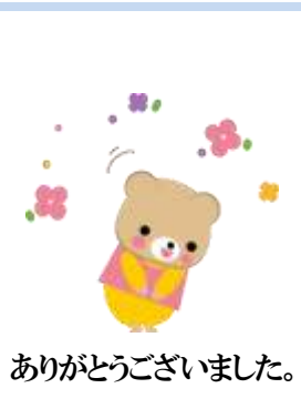
ありがとうございました。