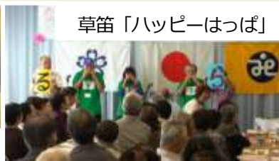
草笛「ハッピーはっぴ」