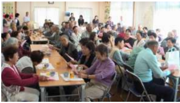
会場内はあっという間に万席に。久しぶりにお会いした方も多様で会場内の至る所で「久しぶりね」という会話が聞こえていました。