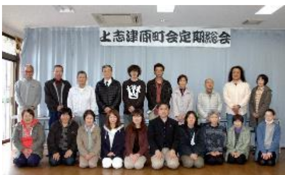
1年間、よろしくお願ひします。