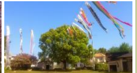
11月 紅葉・いちよう並木ライトアップ