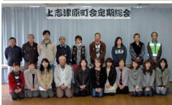
1年間、お疲れ様でした。