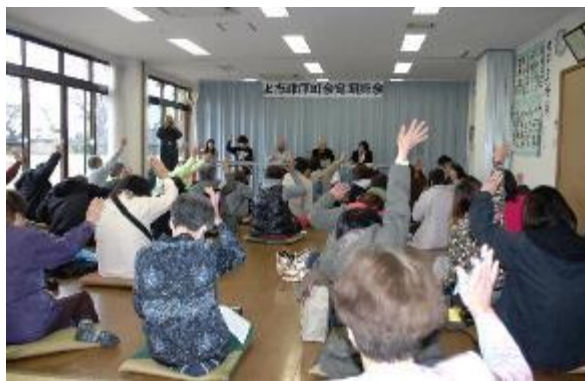
定期総会のもよう