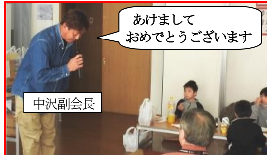
あけましておめでとうございます