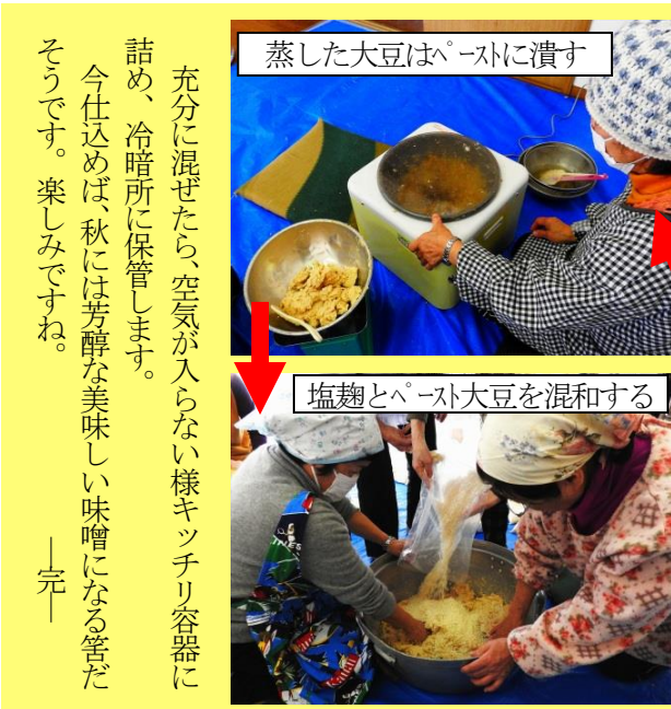
蒸した大豆はペーストに潰す