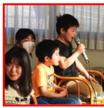
★カラオケ…カラオケの口開けは、何と子供達でした。