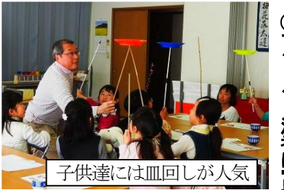
子供達には皿回しが人気