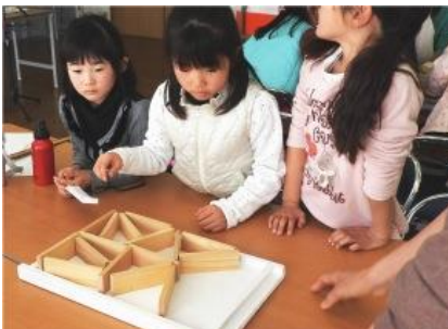
問題... 三角形を九つ作って下さい