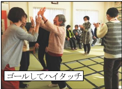
ゴールしてハイタッチ