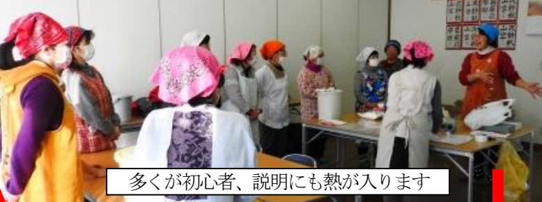
多くが初心者、説明にも熱が入ります

十分に混ぜたら、空気が入らない様キッチリ容器に詰め、冷暗所に保管します。 今仕込めば、秋には芳醇な美味しい味噌になる筈です。楽しみです。 —完—