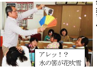
アレッ!? 水の筈が花吹雪