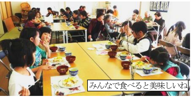
みんなで食べると美味しいね