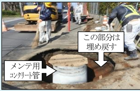
この部分は埋め戻す