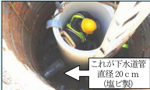
これが下水道管 直径20cm (塩ビ製)