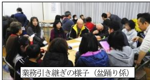
業務引き継ぎの様子(盆踊り係)

当日は寒い日でしたが快晴、日射し一杯のはらトピアは、「お習字」感覚の子供達や「書を楽しむ会」の奥様達で熱気ムンムンでした。