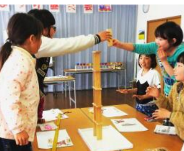
問題... 積み上げて高さ比べです