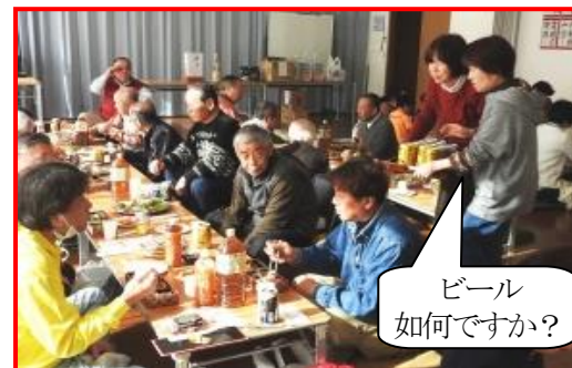
ビール如何ですか？