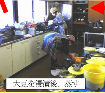
大豆を浸漬後、蒸す