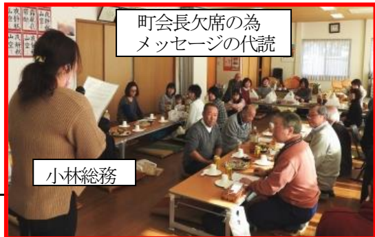
町会長欠席の為メッセージの代読