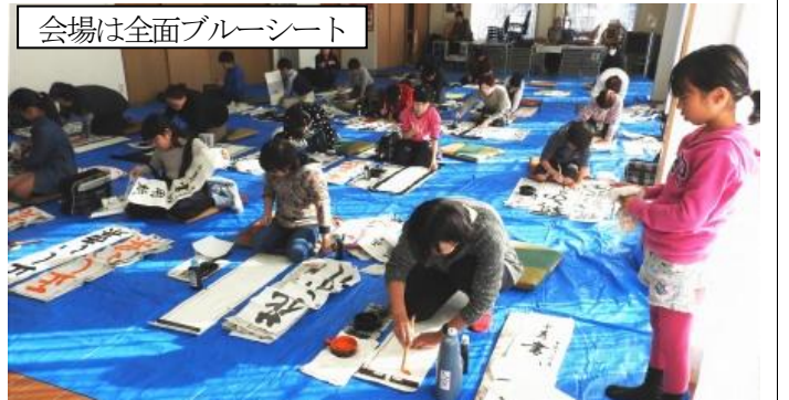
会場は全面ブルーシート