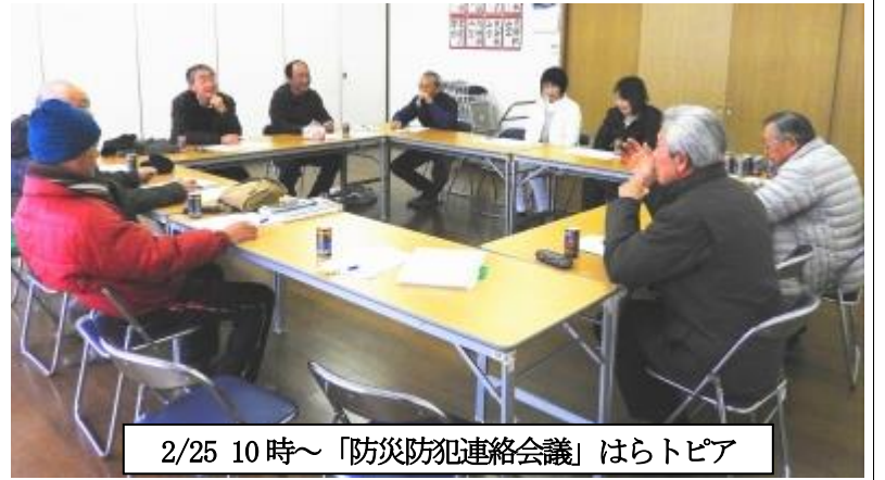
2/25 10時～「防災防犯連絡会議」はらトピア

この記事は、連絡会議の議事録などを報告し、防災防犯連絡会の活動内容を紹介するものです。