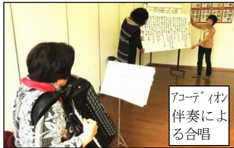
アコースティック伴奏による合唱

ふまネット体操?... 畳に敷いた四角の枠がふまネット。枠を踏まない様、リズムよく前進します。