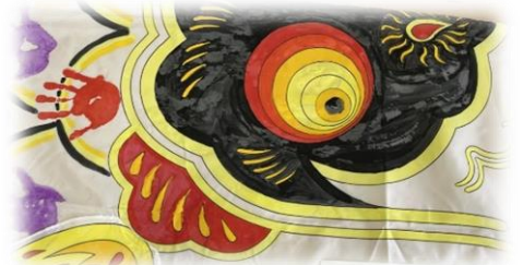
親子ふれあいキャンプで子ども達と作成した鯉のぼりをふれあい通り作品展へ出品