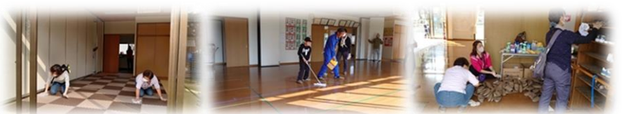
↑ 畳部屋、フローリング、玄関、隅々まで丁寧に清掃しました。

年 2 回の自治会館大掃除。自治会館は「はらトピア」と「南ヶ丘集会所」の 2 カ所、今年度班長さんにご対応頂きました。とても綺麗になりました。ご参加の皆さん、ありがとうございました。